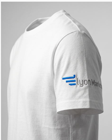
Camiseta — manga