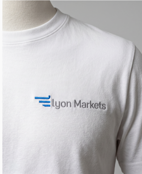
Camiseta — pecho